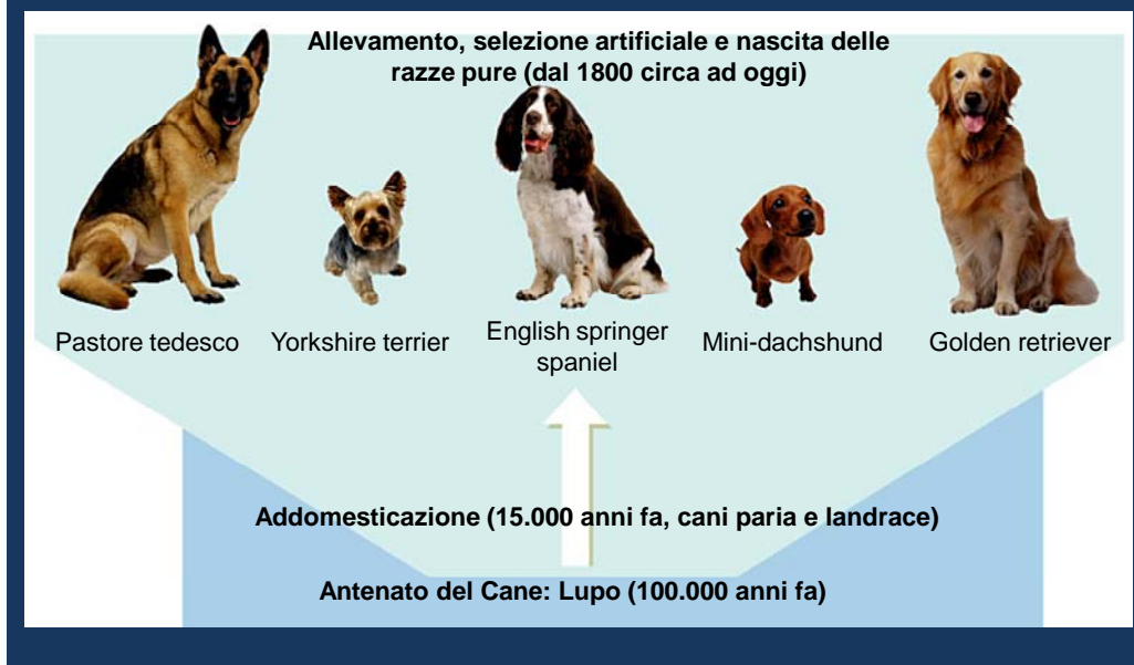
Fig. 3 – L'evoluzione del cane

Il processo di domesticazione , potrebbe essere avvenuto secondo una delle seguenti ipotesi, ma non è da escludere che la combinazione di più di una di queste eventualità abbia contribuito: