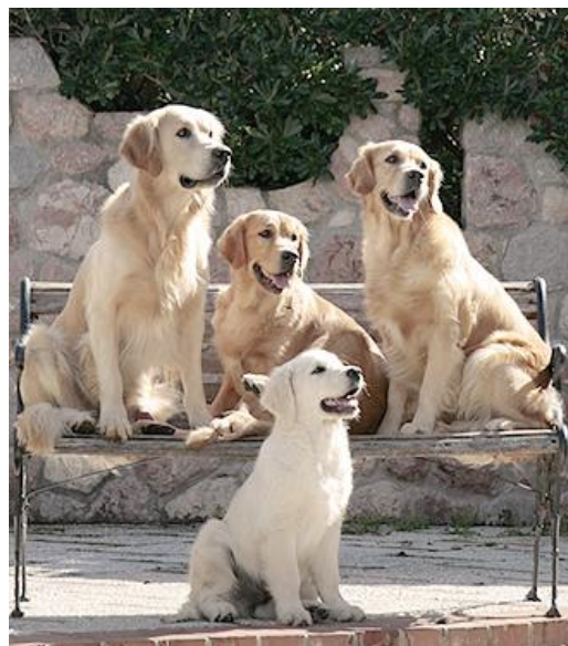
Golden retriever - Moby, Frida, Twinkle, Trevor

Sono cani socievoli e disponibili, amanti dell'uomo, ricercano la sua compagnia. Ottimi compagni, non sono certo adatti ad essere utilizzati come cani da guardia proprio per la loro natura decisamente amichevole nei confronti dell'uomo. Gli appartenenti a questo gruppo