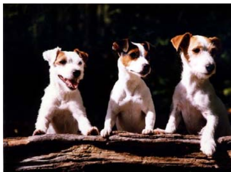
Jack Russel terrier

In questo gruppo sono contenuti quasi tutti i terrier, i discendenti dai terrieri e qualche altra razza. Sono cani temerari, a dispetto della mole per lo più piccola, ed ottimi cani d'allarme, sono infatti prontissimi ad avvertire l'avvicinarsi di qualcuno alla proprietà. Spontanei ed impulsivi non sono semplici da addestrare, se interessati, tuttavia, lavorano volentieri con notevole attitudine alla risoluzione dei problemi.