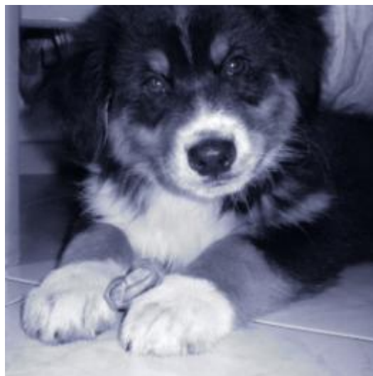
Australian Shepherd - Sugar

Si sconsiglia vivamente di acquistare un cucciolo in un negozio, tolto alla madre prima del tempo esatto, cosa che di norma dovrebbe avvenire dopo circa 50/60 giorni dalla nascita del cucciolo, spedito con un corriere, tenuto in una gabbia vicina ad altri animali di origine molto incerta per svariati giorni e sottoposto ad una serie di stress psicofisici difficilmente quantificabili. La migliore strada da seguire è rivolgersi per l'acquisto ad un serio allevamento, riconosciuto dall' ENCI. Può, chiaramente, capitare che un allevatore sia sprovvisto di cuccioli in un determinato periodo, perchè disponendo di un numero limitato di fattrici, un allevatore serio subordina la pianificazione delle cucciolate su basi ben diverse da quelle unicamente commerciali. Il prezzo richiesto, talvolta, potrebbe essere più alto di quello praticato in un negozio. Gli allevatori, nella quasi totalità, riservano una grandissima attenzione alla produzione delle