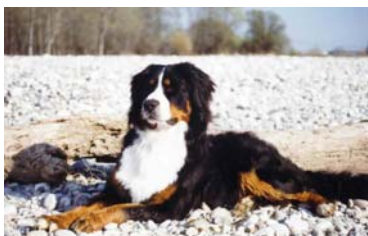
Bovaro del Bernese

I cani al primo stadio neotenuco hanno caratteristiche fisiche prepotentemente infantili, tipiche dei cuccioli di lupo nelle prime due o tre settimane di vita. Il muso è corto, le orecchie piccole e pendenti, il cranio tondeggiante, il corpo tozzo e